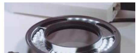
Segmentierbares Polfilterset für Ringlicht S80-55 (Abb. rechts)