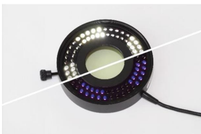
„VisiLED Ringlicht S80-55UV“ für UV und Hellfeld (Abb. links)